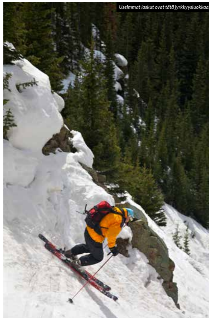
Useimmat laskut ovat tätä jyrkkyyssuokkaa.

Bussin kyljessä olevassa kyltissä luki ”Silvertonin kasvatuslaitos”, ja parkkipaikalle kertyvää laskettelijoiden ja lautailijoiden ryhmää katsoessa mietinkin, että he olisivat hyvinkin voineet olla paikallisesta vankilasta. Yksi asia kuitenkin ei sopinut tuohon kuvitelmaan: kaikki olivat todella ystävällisiä ja avuliaita.