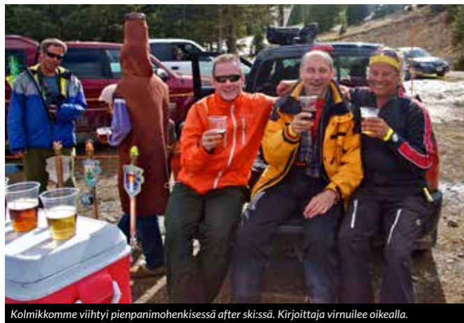
Kolmikkomme viihtyi pienpanimohenkissä after ski:ssä. Kirjoittaja virnuilee oikealla.

Papi onnistui ostamaan kaksi uudelleen lämmitettyä burritoa Avalanche-kahvilasta, jossa lattia oli jo mopattu päivän päätteeksi; paikalla oli kuitenkin kaksi työntekijää. Itse halusin nestemäistä illallista paikallisesta saluunasta. Pääruokanani toimi Bloody Mary, jälkiruokana Screwdriver ja palanpainikkeena lasillinen paikallisen pienpanimon olutta.