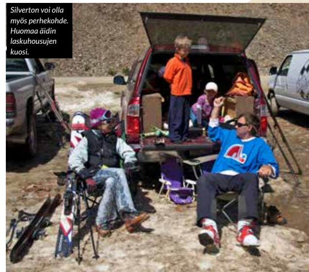
Silverton voi olla myös perhekohte. Huomaa äidin laskuhousujen kuosi.

rässä. Vuoren itäisen ja läntisen kupeen välissä on myös muutama lasku pohjoiseen päin. Ne ovat todella kapeita, ja niiden nimet – Köysi, Naru, jne. – heijastavat niiden olemusta varsin hyvin.