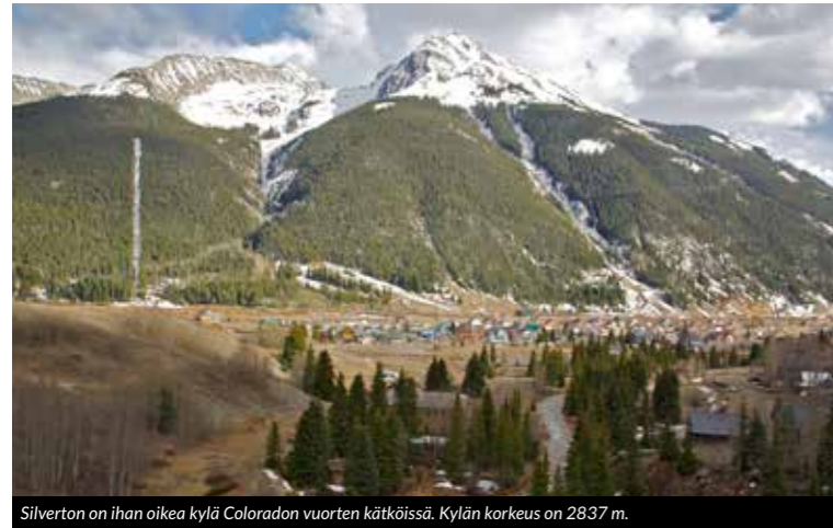
Silverton on ihan oikea kylä Coloradon vuorten kätöksissä. Kylän korkeus on 2837 m.