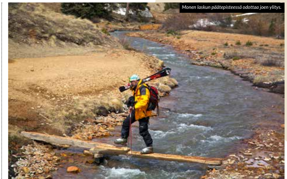
Monen laskun päätepisteessä odottaa joen ylitys.

Suurimman osan ajasta opas on Silvertonissa pakollinen, ja 140 dollarin hintaan saa päivälipun, johon sisältyy opastus, joka on-