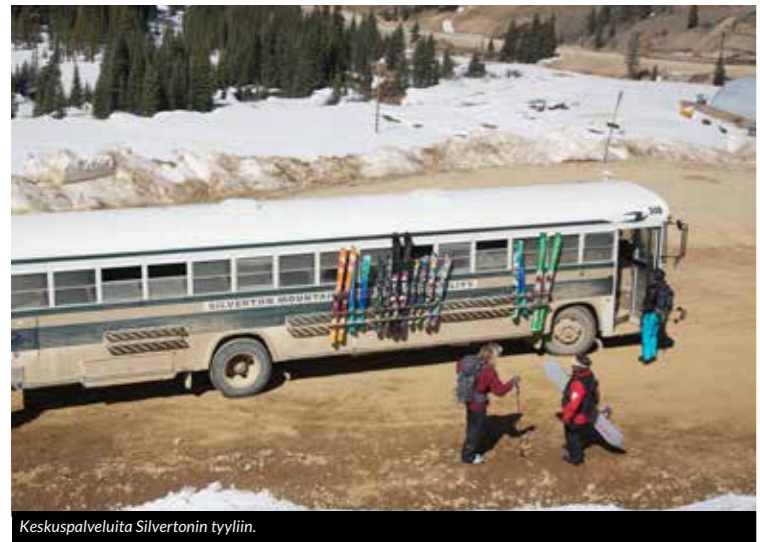
Keskuspalveluita Silvertonin tyyliin.