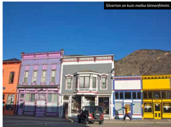
Silverton on kuin matka lännenfilmiin.

Henkilökunnasta kukaan ei ollut nähnyt partahöylää pitkään aikaan, ja kaikkien vaatetuksesta olisi voinut päätellä lähimmän pesukoneen sijaitsevan ihan toisessa osavaltiossa. 1960-luvulla olisin varmasti luullut törmänneeni hippikommuuniin tai appalakkilaisiin turvuijiin.